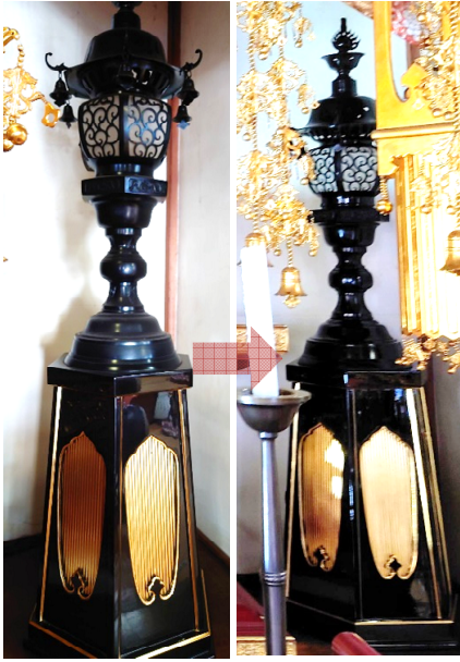
灯籠、灯籠台、厨子、燭台等、須弥壇上の仏具もピカピカに再生します。