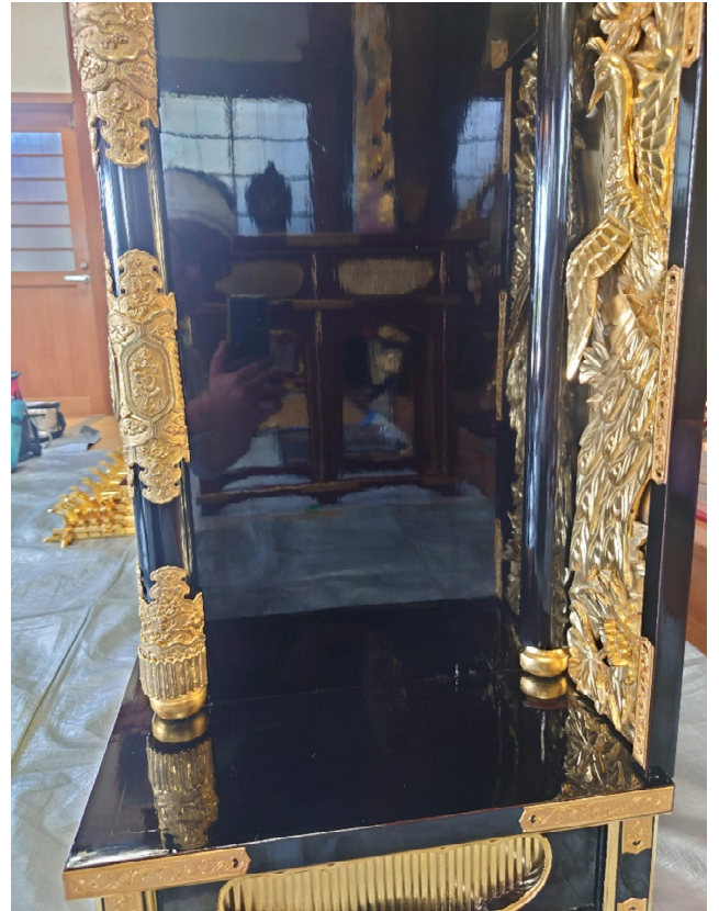
漆の鏡面度がここまで上がります。