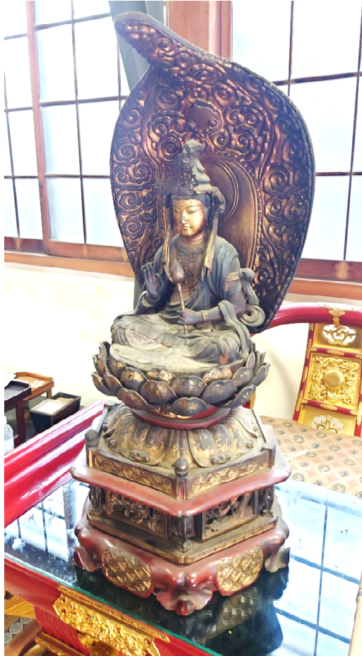
今回は雰囲気を変えないためにご本尊は洗浄しませんが、しっかりと埃を除去し、弊社のオリジナル技術で本体に負担をかけない簡易クリーニングを施工。明るくなりました。