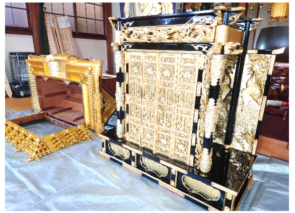
須弥壇も1段毎に分解し、宮殿もバラバラに分解して、漆の磨き、金箔洗浄、金箔補修、コーティング施行を行います